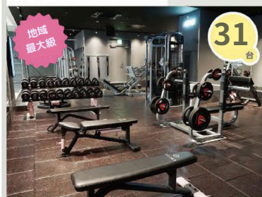
フリーウエイトエリア