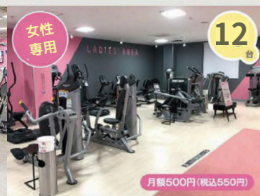
レディースエリア