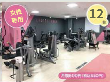
レディースエリア