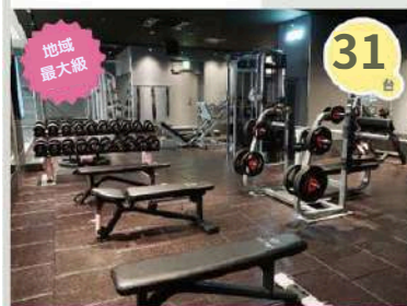
フリーウエイトエリア