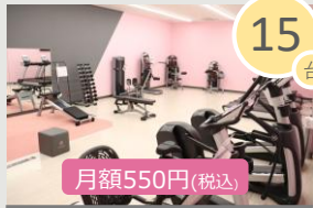
レディースエリア