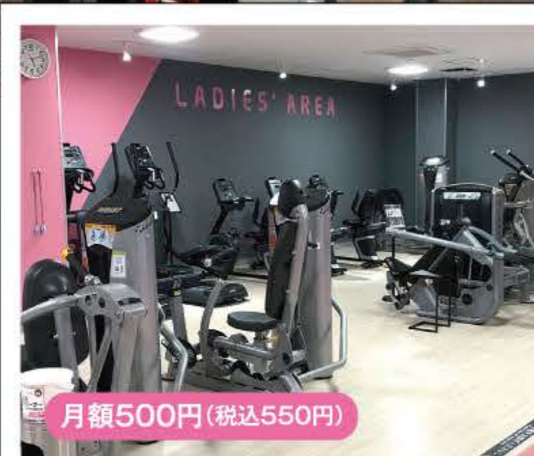
レディースエリア 月額500円(税込550円)