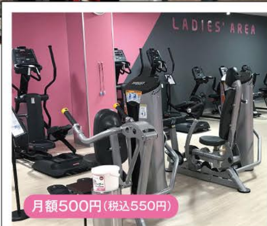
レディースエリア 月額500円(税込550円)