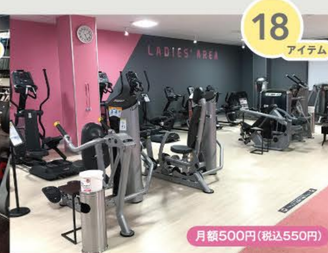
レディースエリア