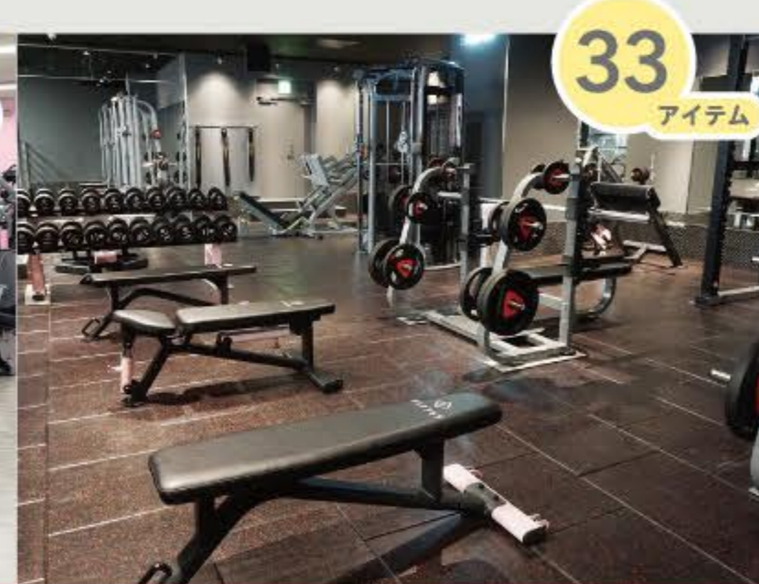
フリーウエイトエリア