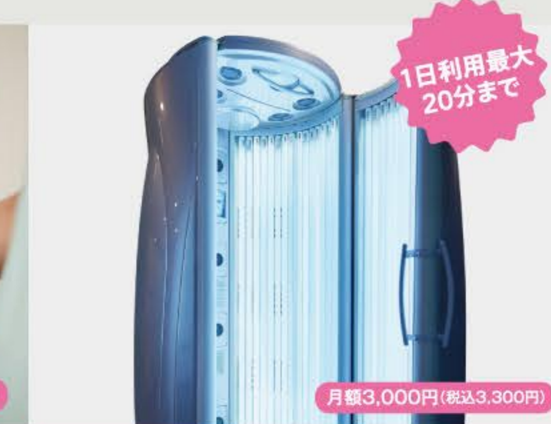
タンニングマシン