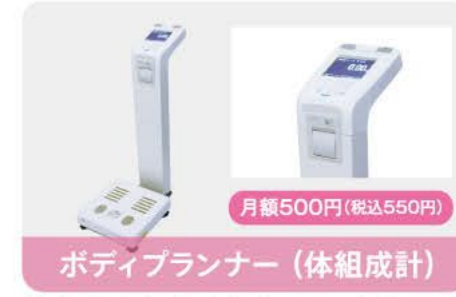
ボディプランナー (体組成計)

人気の高濃度水素水マシンを導入。定額で飲み放題のサービスです。トレーニング中に気軽に飲める専用ボトルもご用意しています。