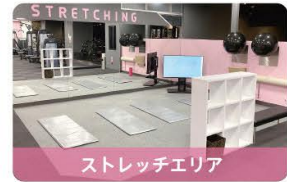
ストレッチエリア

マシンがトレーニングのサポートをしてくれるので、初めての方も、経験者の方も、思う存分使いこなせます。