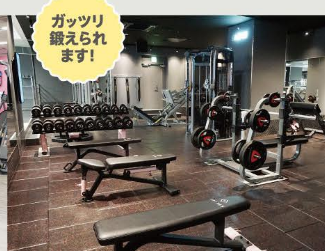
フリーウエイトエリア