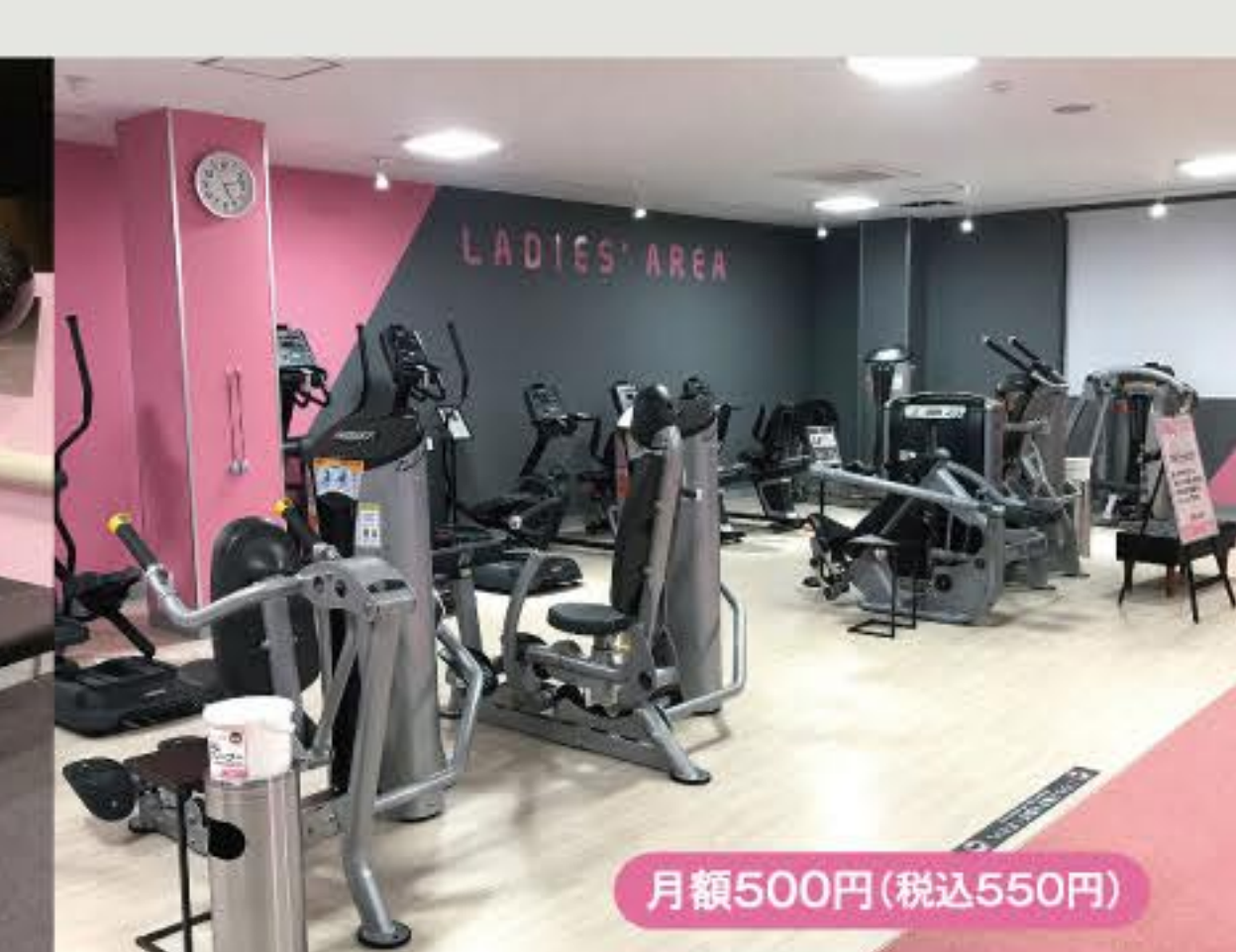
レディースエリア