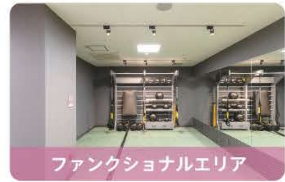
ファンクショナルエリア

マシンがトレーニングのサポートをしてくれるので、初めての方も、経験者の方も、思う存分使いこなせます。