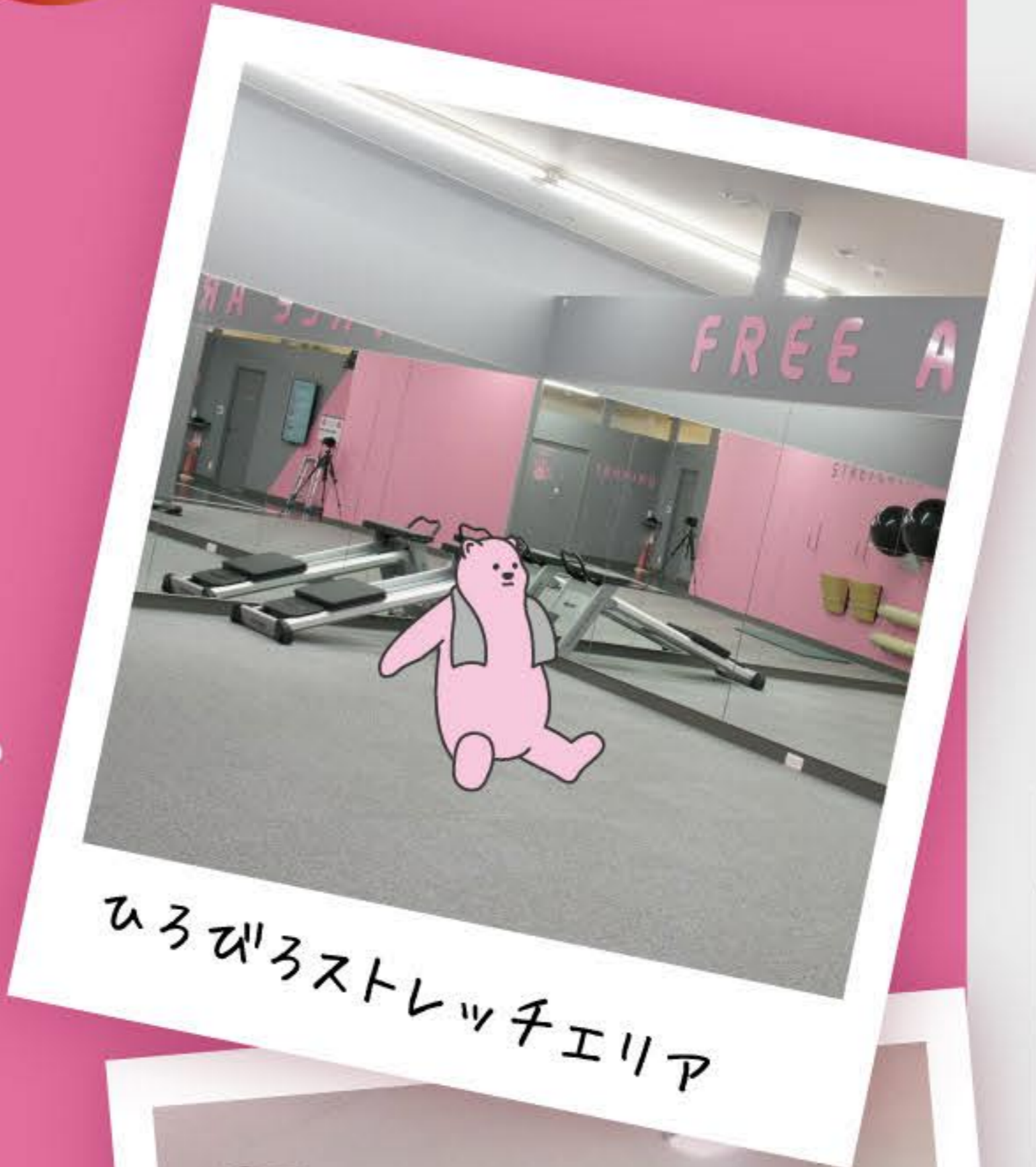
ひろひろストレッチエリア