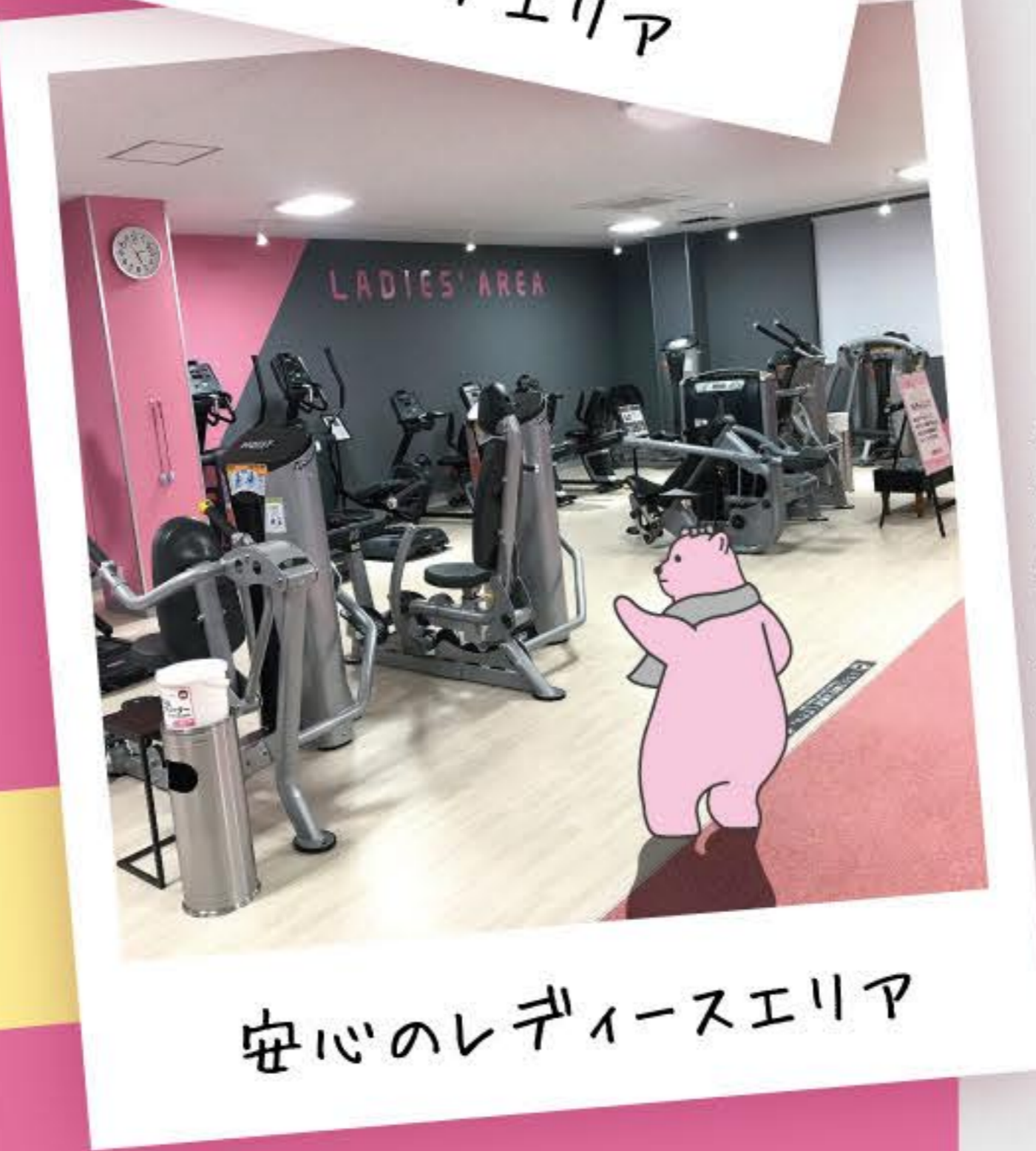
安心のレディースエリア