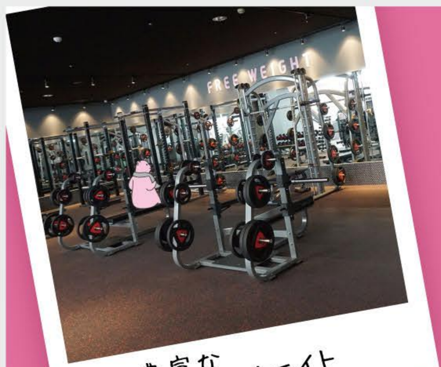
豊富な フリーウエイト