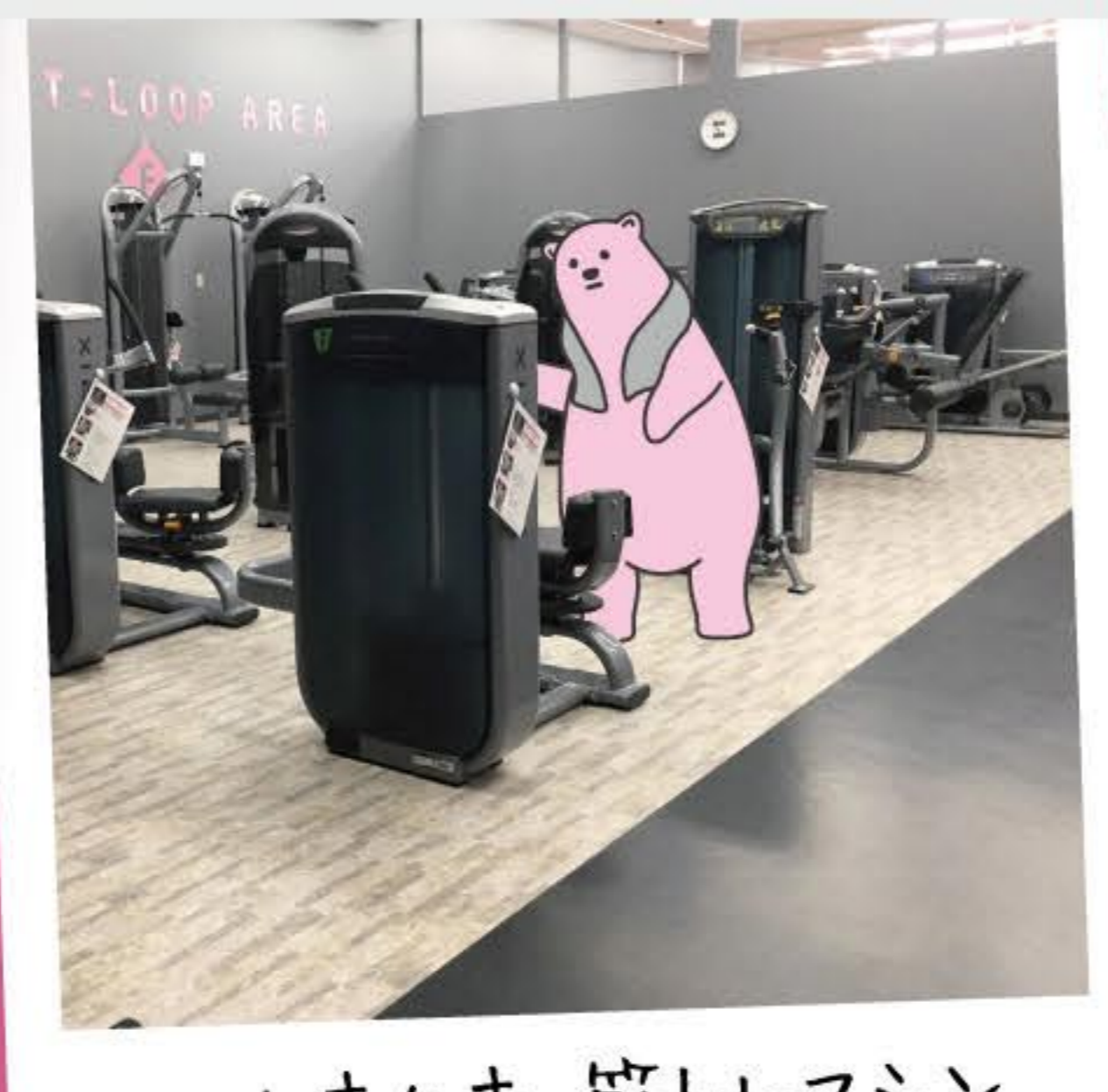
ムキムキ 筋トレマシン