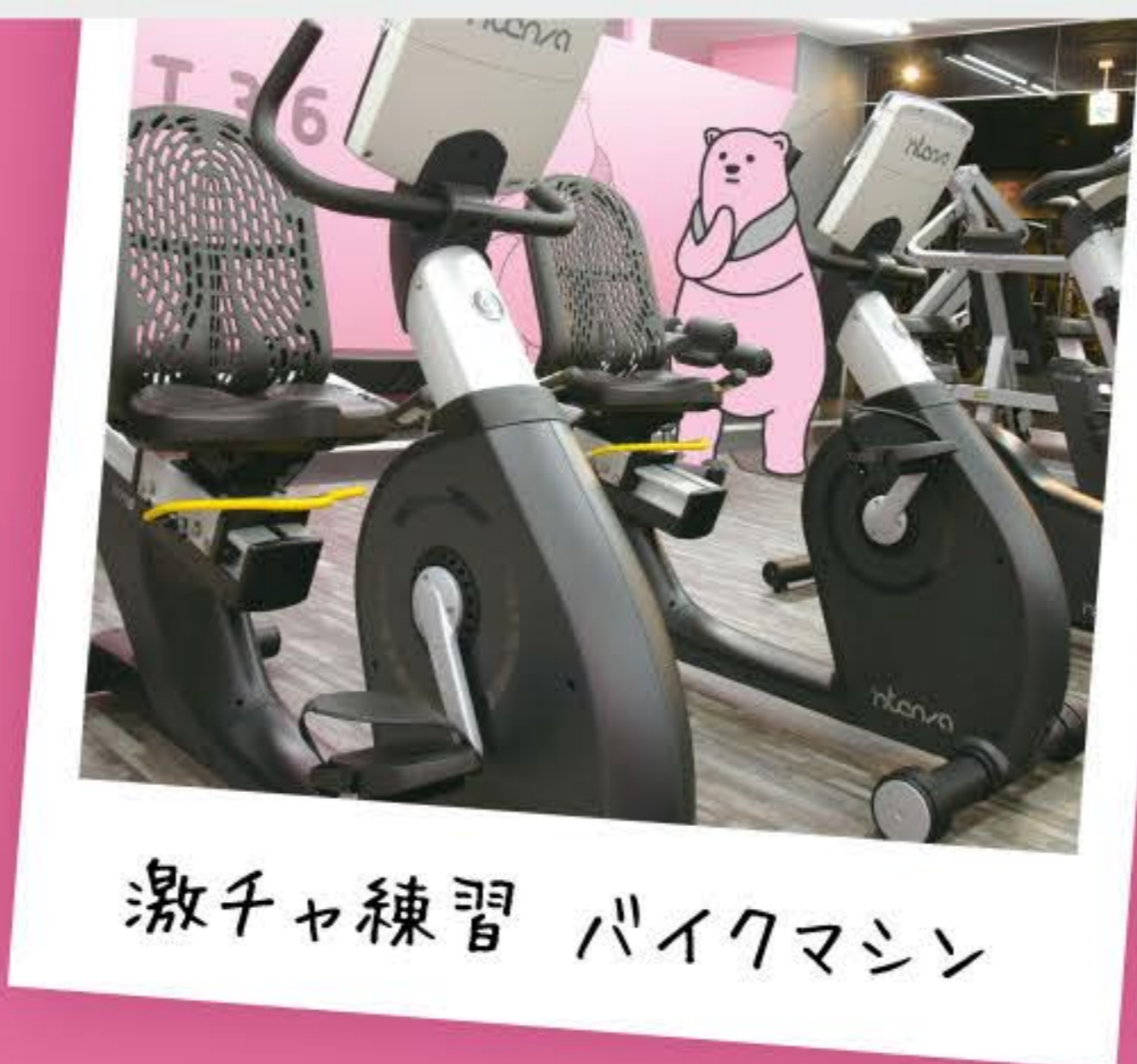
激チャ練習 バイクマシン