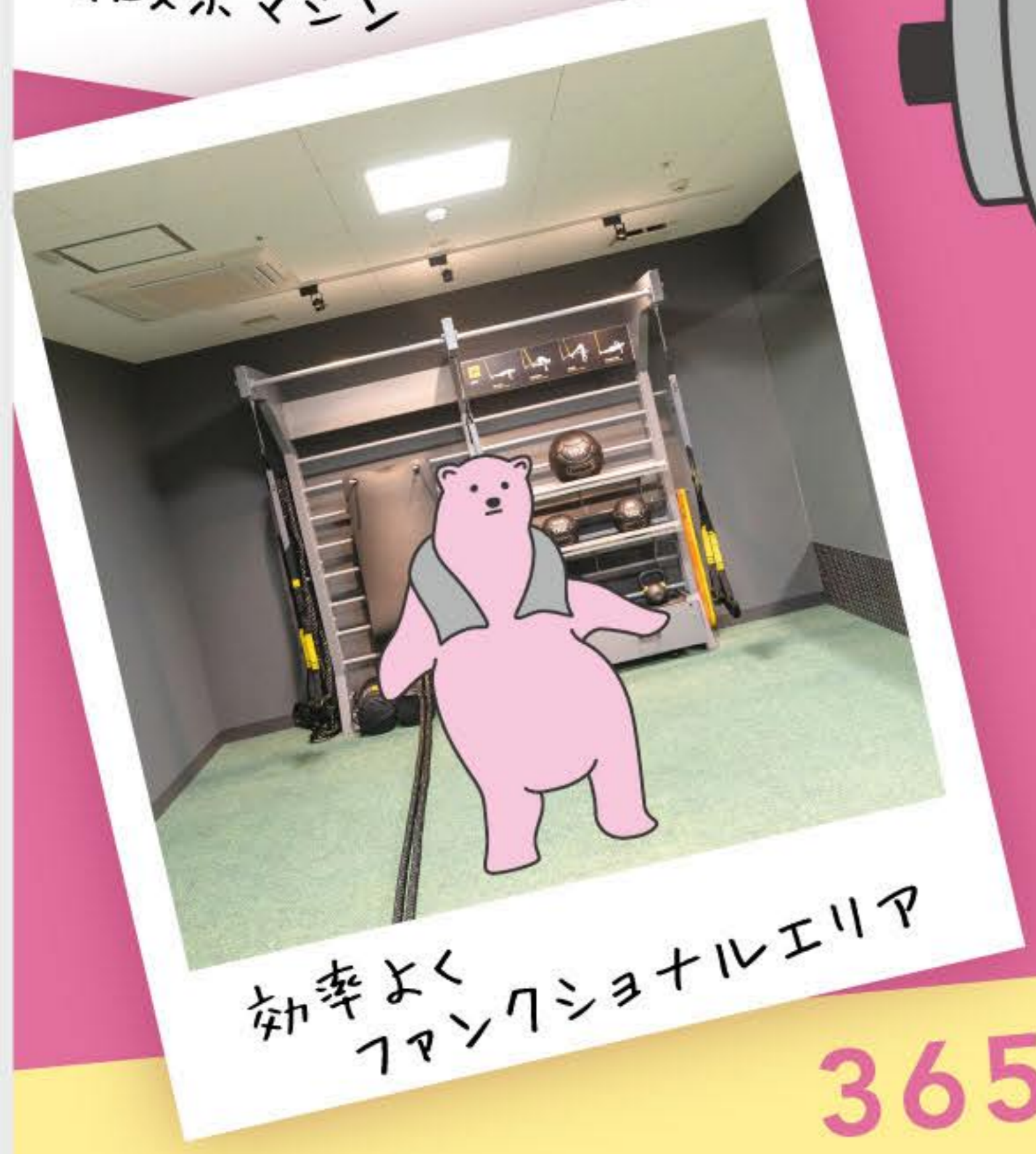
効率よく ファンクショナルエリア