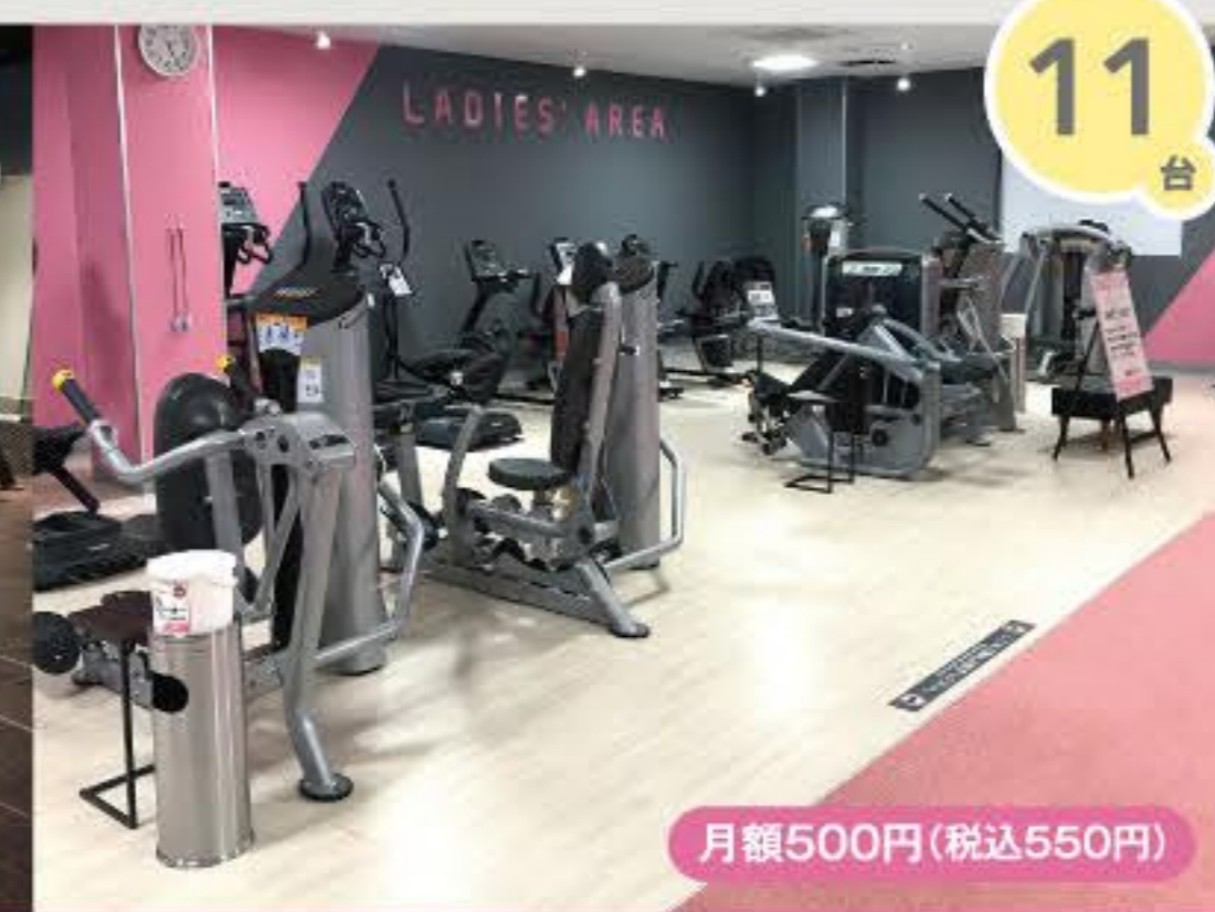
レディースエリア