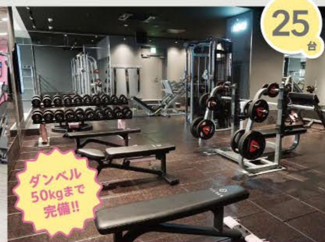
フリーウエイトエリア