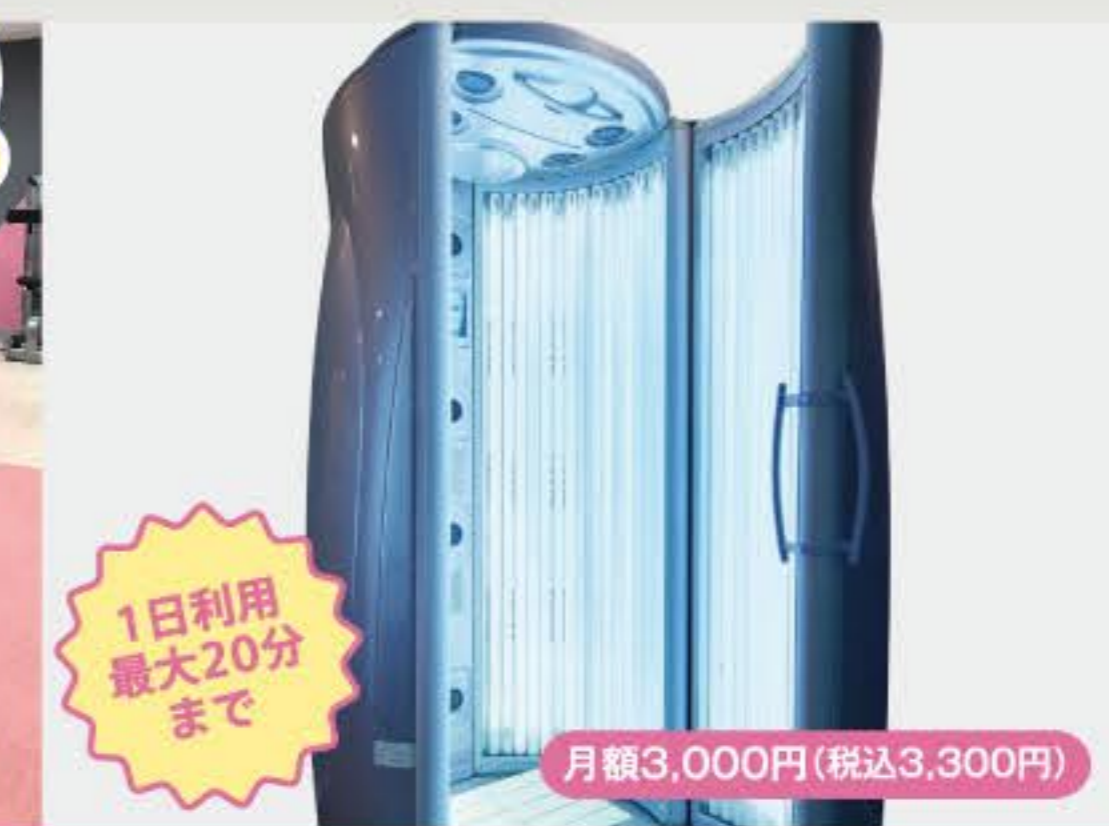
タンニングマシン