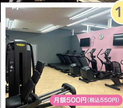
レディースエリア