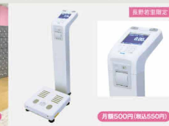
ボディプランナー(体組成計)