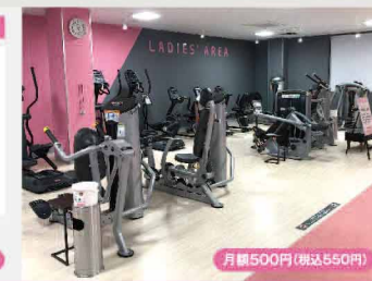
レディースエリア