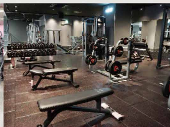
フリーウエイトエリア