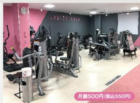
レディースエリア