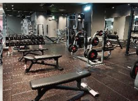
フリーウエイトエリア