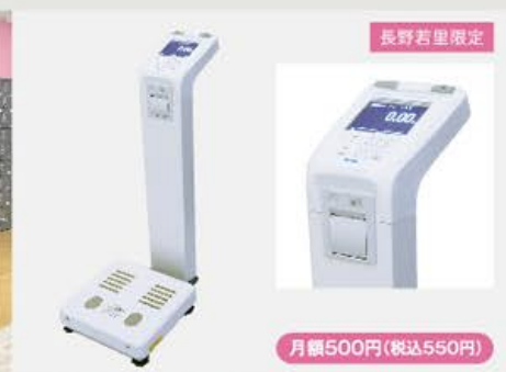
ボディプランナー (体組成計)