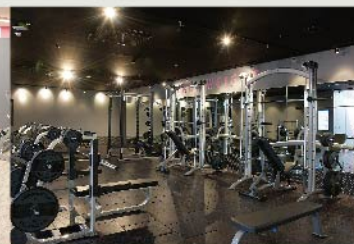
フリーウエイトエリア