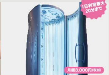
タンニングマシン