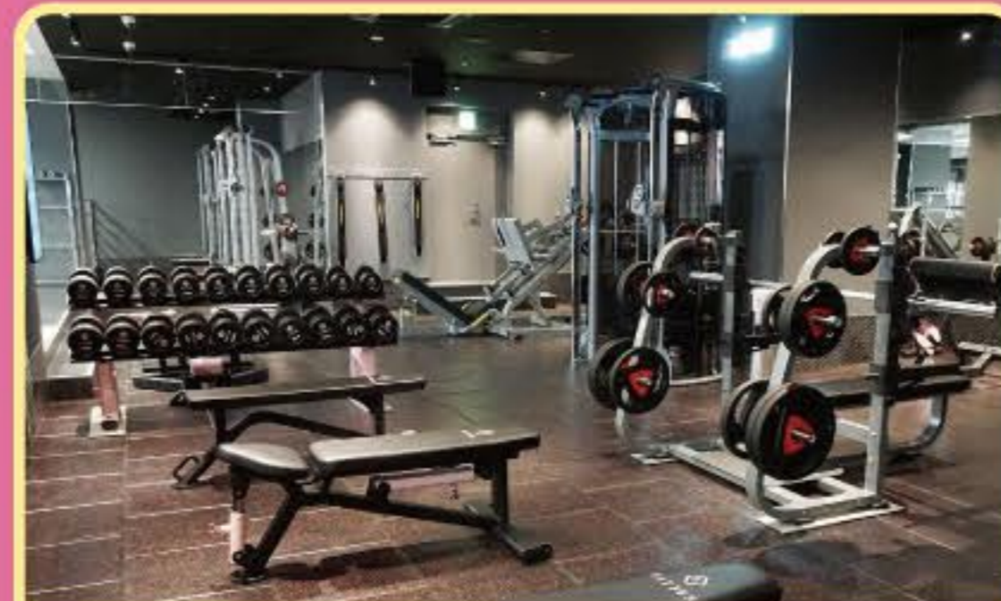
フリーウエイトエリア