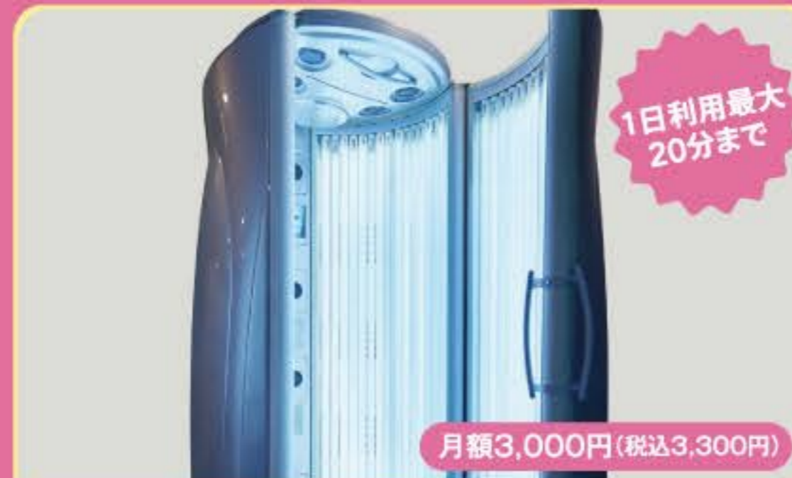
タンニングマシン