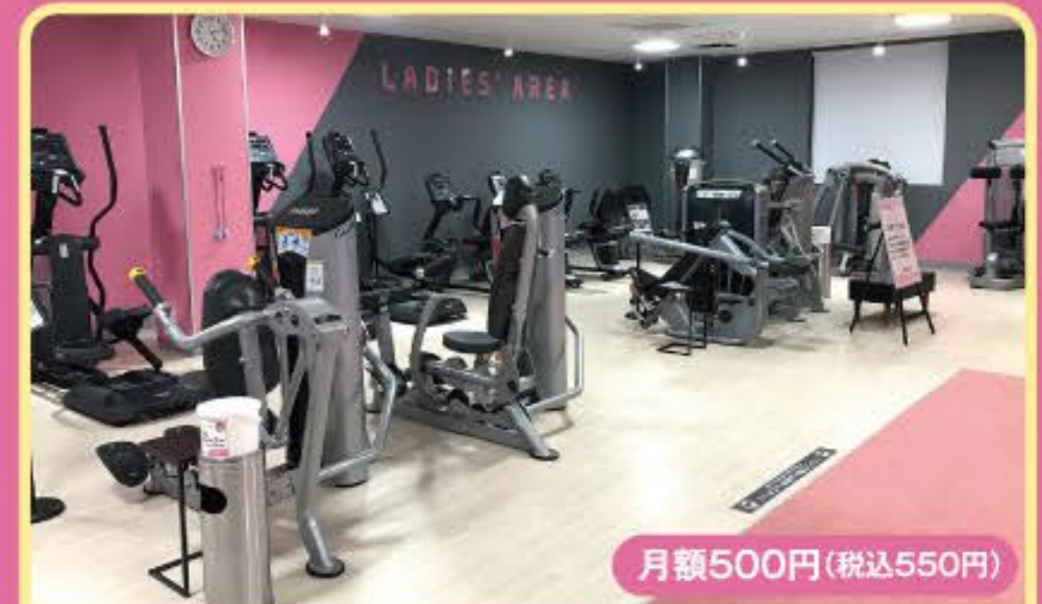
レディースエリア