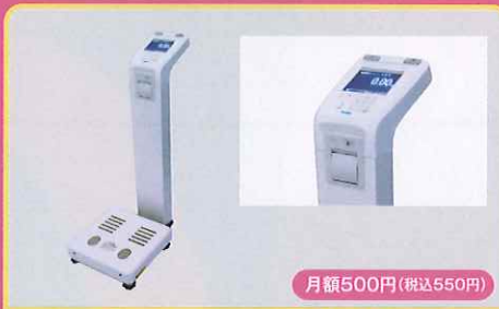
ボディプランナー (体組成計)