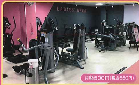
レディースエリア