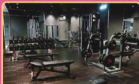
フリーウエイトエリア