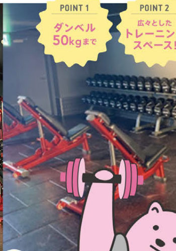
レディースエリア 月額500円(税込550円)