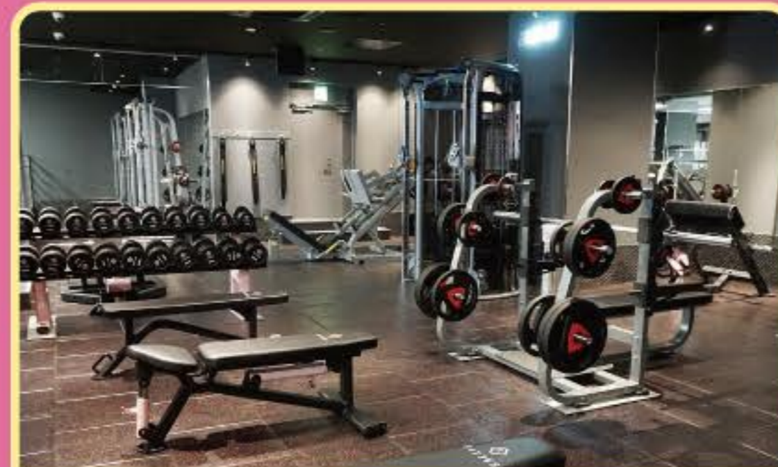
フリーウェイトエリア

※家族会員は、1名の会員様につき2名様以内のご家族3名まで無料でご利用いただけます。同時利用はできません。※ご入会時に会員カード発行料が5,000円(税込5,500円)がかかります。※セキュリティ管理/施設メンテナンス料年額4,980円(税込5,478円)がご利用開始月を初月として3ヶ月目にかかります。