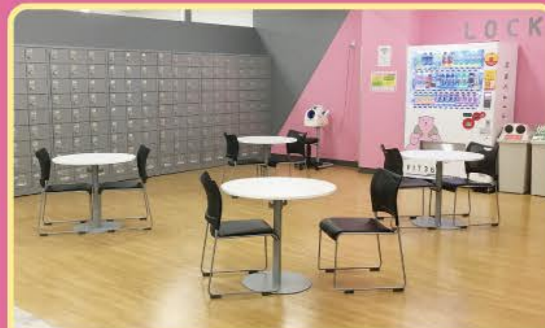
サイレントエリア