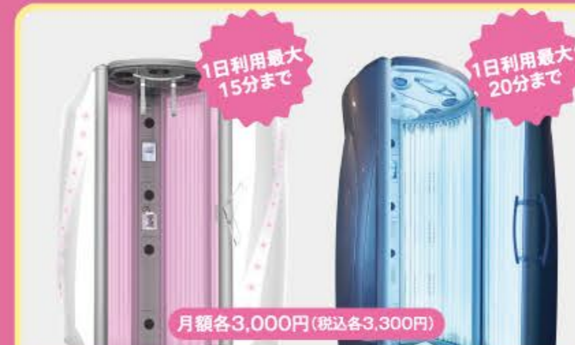
コラーゲンマシン タンニングマシン