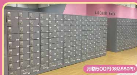
契約ロッカー 月額500円(税込550円)