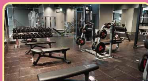
フリーウエイトエリア