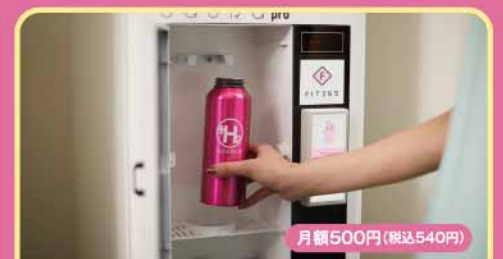
水素水サービス 月額500円(税込540円)