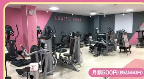
レディースエリア 月額500円(税込550円)