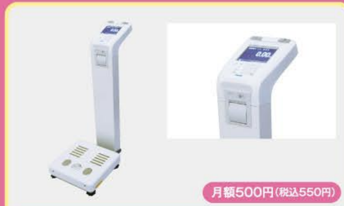
ボディプランナー