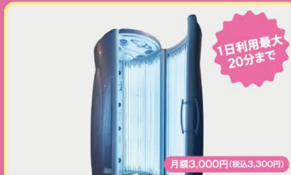
タンニングマシン