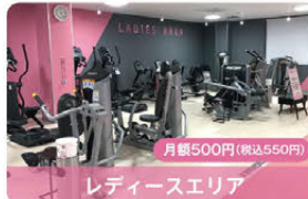
レディースエリア 月額500円(税込550円)

安心のセキュリティで、他の方の視線が気になる女性の方も気兼ねなくトレーニングができます。(家族会員共有OK!)