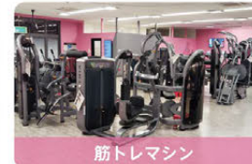
筋トレマシン 月額500円(税込550円)

安心のセキュリティで、他の方の視線が気になる女性の方も気兼ねなくトレーニングができます。(家族会員共有OK!)