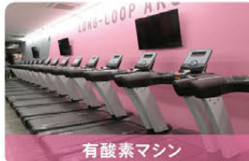
有酸素マシン 月額500円(税込550円)

マシンがトレーニングのサポートをしてくれるので、初めての方も、経験者の方も、思う存分使いこなせます。