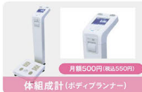
体組成計(ボディプランナー) 月額500円(税込550円)

豊富なランニングマシンで雨の日も問題なくランニング。スピードや傾斜などのプログラムができ、脂肪燃焼に効果的です。