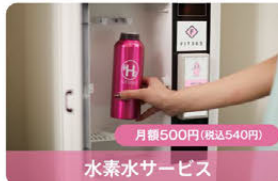
水素水サービス 月額500円(税込540円)

シューズやトレーニングアイテムの管理にとっても便利な鍵付きのロッカーなので、貴重品の管理にも安心です。(家族会員共有OK!)