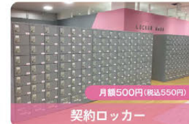
契約ロッカー 月額500円(税込550円)

体重・体脂肪・内臓脂肪・骨量・水分量などを、左右の腕・足の部位ごとに測定できます。専用アプリで測定履歴や、身体の状態の変化をチェックできます。