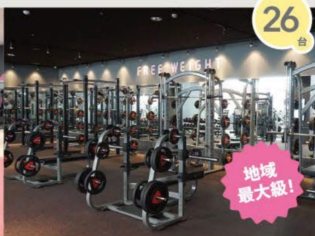
レディースエリア