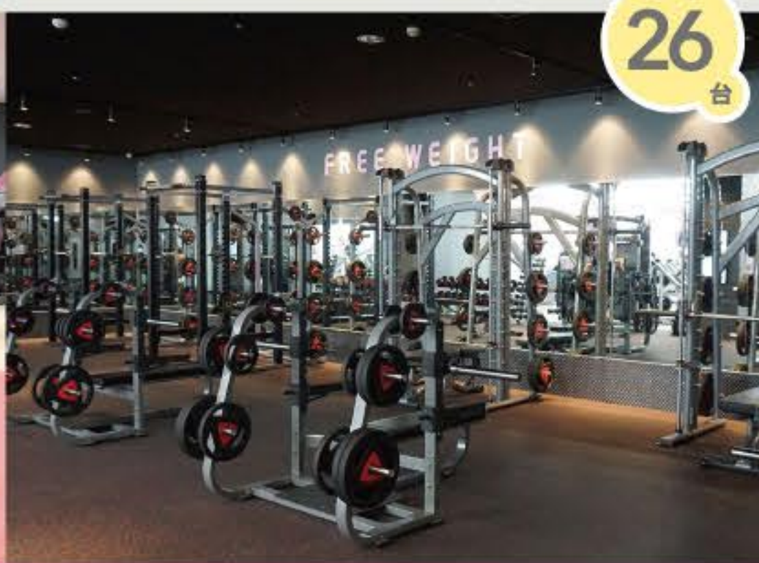
フリーウエイトエリア