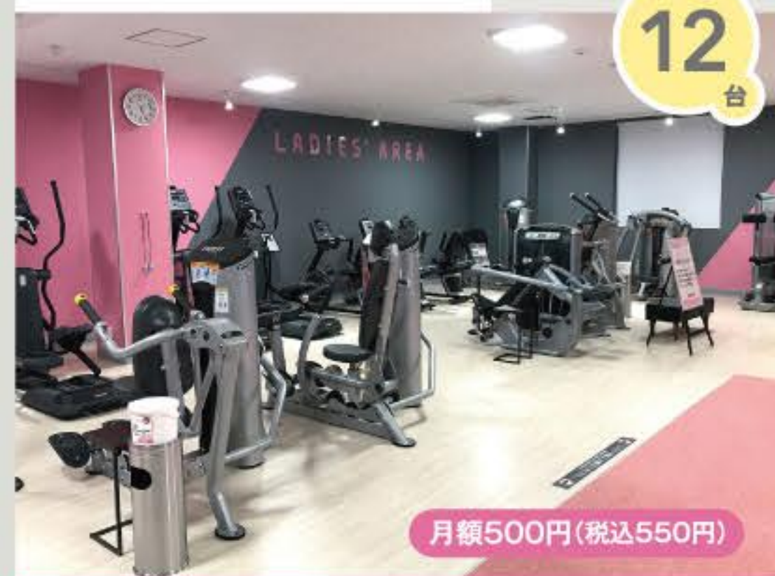
レディースエリア