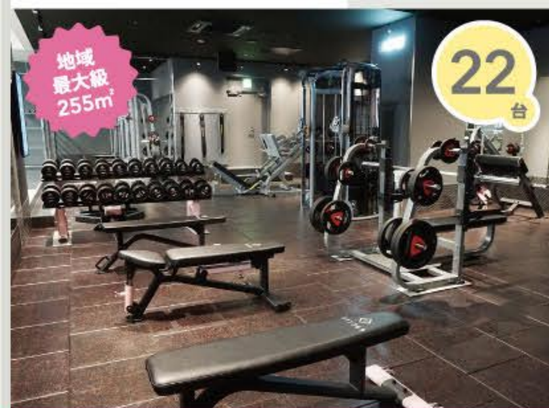
フリーウェイトエリア