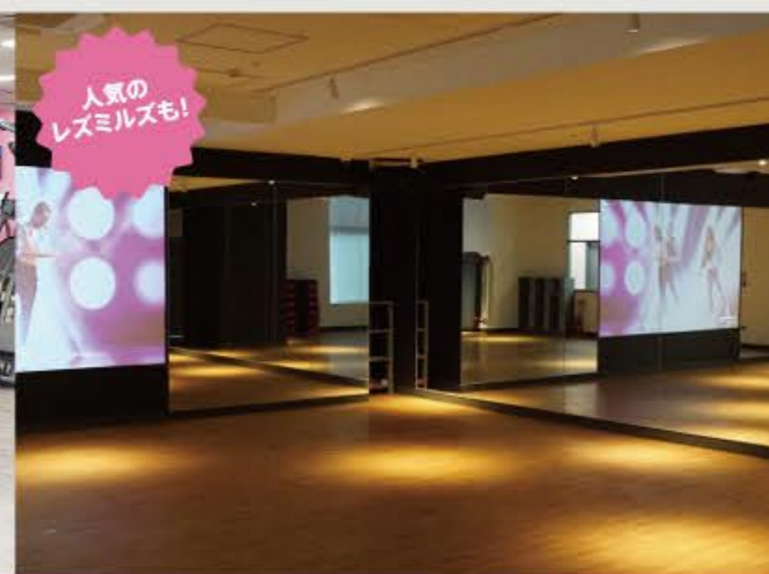
ヴァーチャルスタジオ