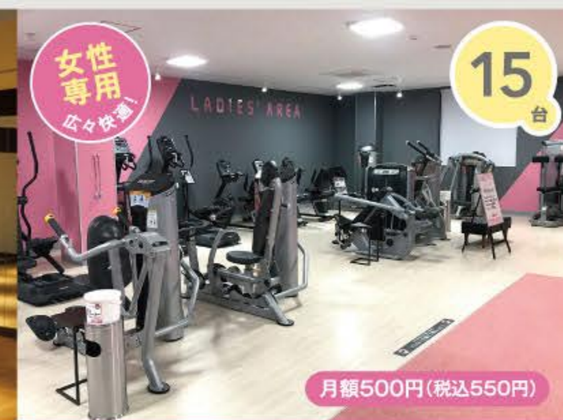
レディースエリア