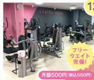
レディースエリア